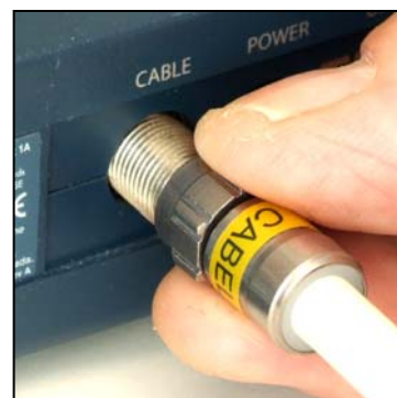
Le Self-Install™ et son écrou adapté à un serrage manuel