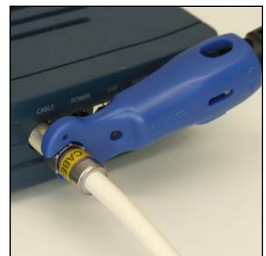
Montage du connecteur avec le Pocket installer