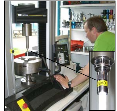
Contrôle de la tenue à la traction