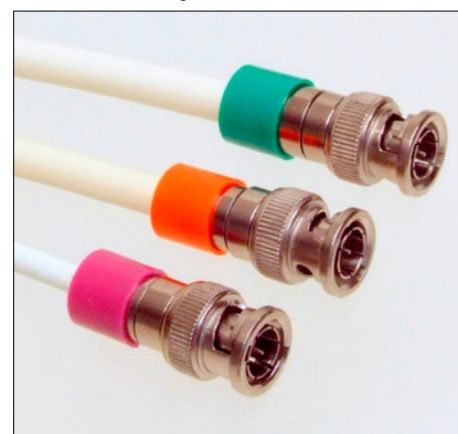
Les bagues installées sur des connecteurs BNC CX3 à compression