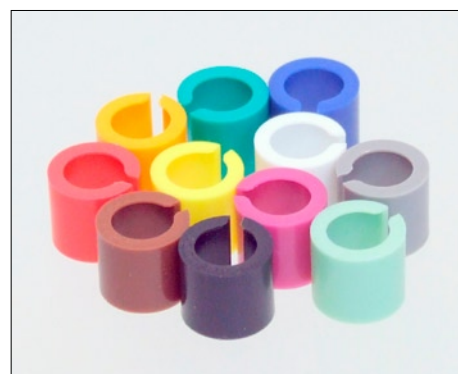
Les 11 couleurs des bagues d'identification Cabelcon