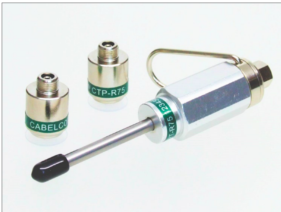
Nouvelle charge anti fraude et son outil