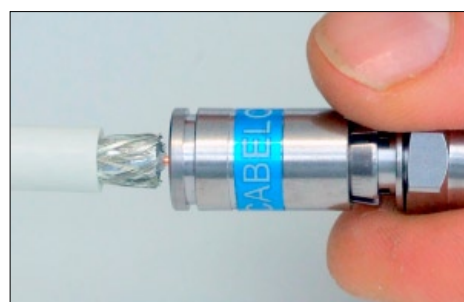
Montage en douceur avec 2 doigts, même sur des câbles PE durs et froids

L'installation est plus facile que jamais. Des essais sont actuellement en cours avec plusieurs grands opérateurs européens qui sont séduits par la facilité de montage de ce nouveau connecteur CX3 7,0 à compression. Essayez-le et vous serez convaincu.