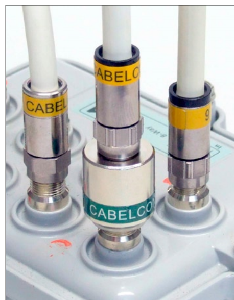
Charge anti fraude CTP-R75 avec connexion aveugle (uniquement pas de vis) pour la câble abonné non utilisé

On pourra aussi les installer sur nos connecteurs UltraEase™. Les bagues couleur Cabelcon sont destinées au départ à l'identification des câbles et connecteurs audio/vidéo dans les racks sur les marchés broadcast et sécurité. Elles sont équipées d'une fente souple pour permettre montage après l'installation du connecteur. Les bagues couleur sont réalisées à partir d'un polymère très résistant et souple et sont disponibles en 11 couleurs.