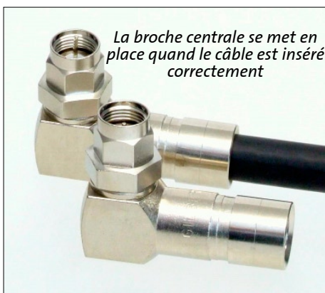
La broche centrale se met en place quand le câble est inséré correctement Le nouveau connecteur UltraRange® GAF-UR-11 RA avec le 90° Push Pin réf.99909278!

Enfin le nouveau connecteur UltraRange GAF-UR-11 RA bénéficie également du traitement de surface Nitin-6™ de Cabelcon.