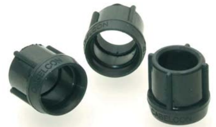
Dichtungsring für F-Konnectoren 99900902

Cabelcon hat vor kurzem einen neuen EPDM-Dichtungsring für F-Konnectoren herausgebracht, der für unsere Steckerlinien UltraEase™ und Self-Install™ vorgesehen ist. Damit wird eine vollständig wassergeschützte Installation gewährleistet.