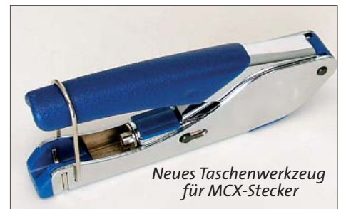
Neues Taschenwerkzeug für MCX-Stecker