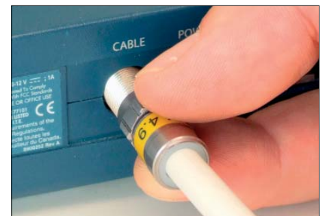
Automatische Kompression bei der Installation – es ist kein Kompressions- werkzeug erforderlich!