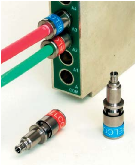
Neue CX3 MCX-Stecker für Minikabel

Die Cabelcon MCX-Stecker sind mit unserem patentierten PushPin™-System ausgestattet.