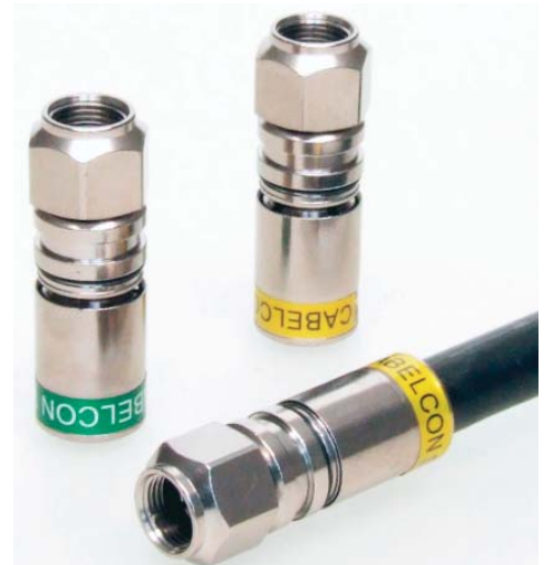
RG11 QuickMount™ in zwei Größen

Müssen wir eigentlich noch erwähnen, dass die technischen Daten die besten in dieser Klasse sind?