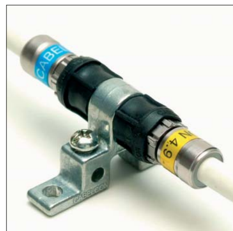
Bagues d'étanchéité mise en place sur nos connecteurs Self-Install™

Les Self-Install™ étanches sont marqués avec un W (pour waterproof) indiqué après le diamètre d'insert du connecteur (4.9W et 5.1W).