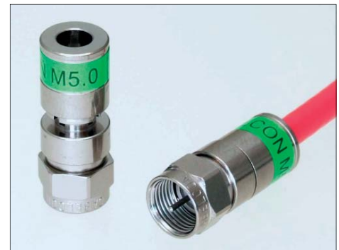
CX3 FM pour câble mini 5.0