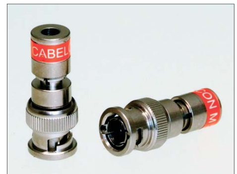
CX3 BNC male pour câble mini 4.0