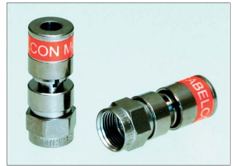
CX3 FM pour câble mini 4.0

Les désignations des connecteurs Cabelcon mini (3.1, 4.0, 4.5 et 5.0) se réfèrent à la taille de la gaine extérieure du câble, ce afin d'identifier plus facilement le câble adapté.