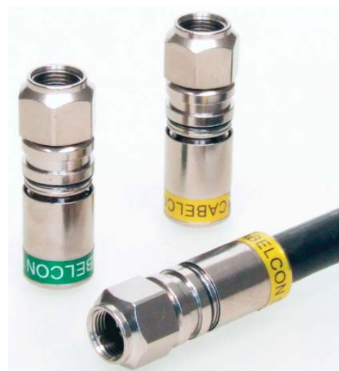
Le connecteur RG11 Quickmount™ type QM 10,5 et 11,0

La gamme CX3 Quickmount™ est équipée du système breveté « push-pin » assurant une très bonne prise mécanique sur l'âme du câble et permettant de visualiser un montage correct du connecteur.