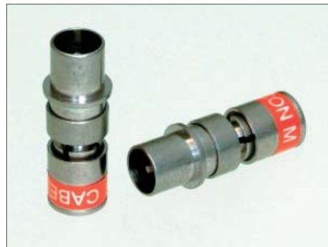
CX3 IEC male for mini cable 4.0