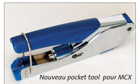
Nouveau pocket tool pour MCX