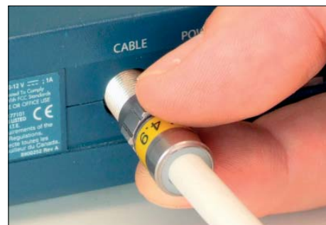
La compression est automatique durant l'installation – pas besoin d'outils !